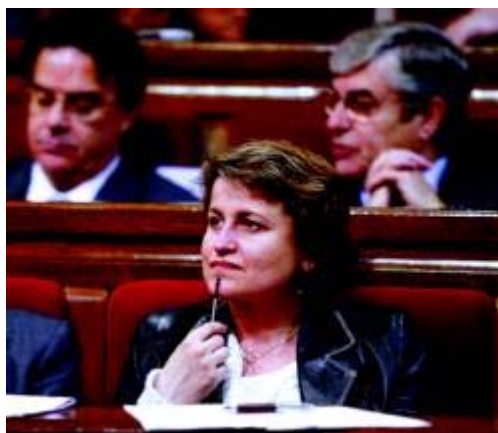
La consellera de Benestar i Família, Anna Simó, ahir, al Parlament.